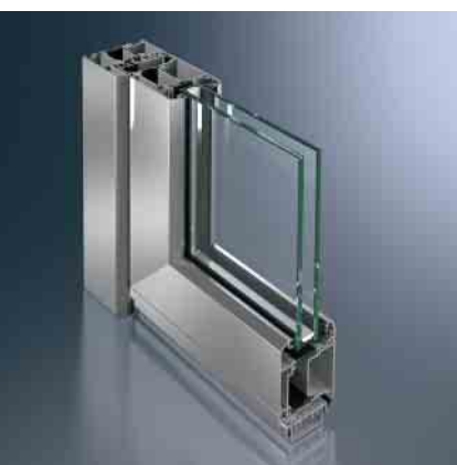
Schüco Tür ADS 65 RL Schüco Door ADS 65 RL